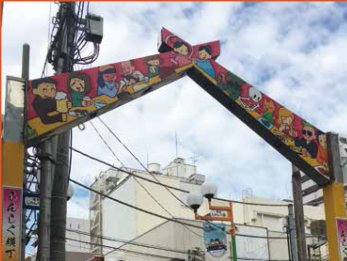
紅谷しんしく商店会様