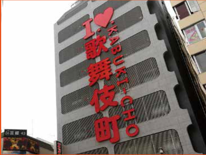
株式会社林不動産様