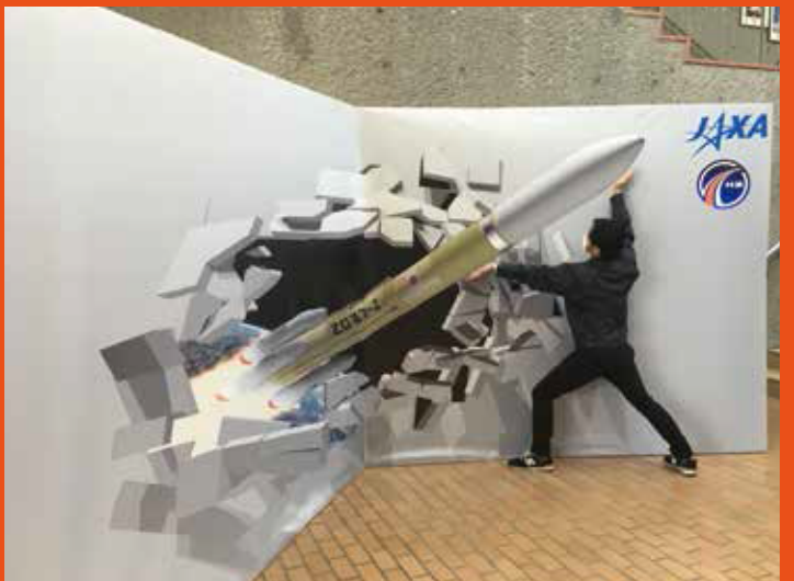
JAXA(宇宙研究開発機構)様