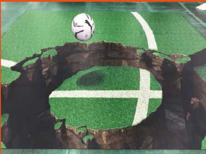
株式会社スクウッド様