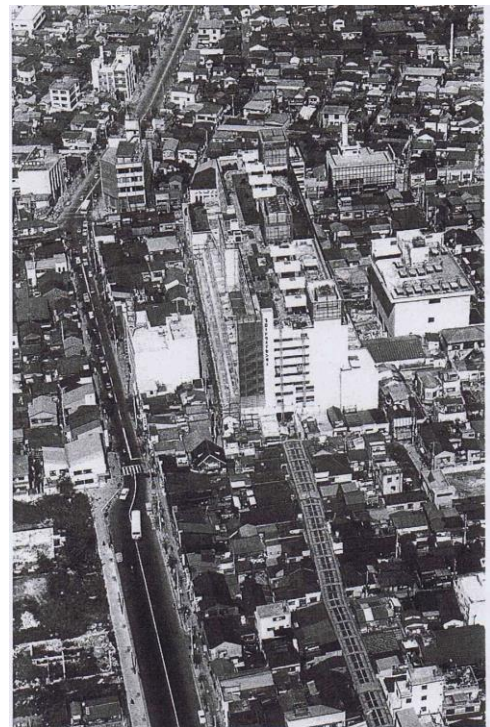
手前中央にかかるサンモールの屋根につづく形で中野ブロードウェイが建つ。 [都市出版「東京人」2012 年 2 月号 p118 より引用]

こうした歴史背景をふまえると、あらゆる情報がインターネットで得られる時代にあって、わざわざ中野に向こうとする人は、単に物を買いに來るのではなく、中野という街が醸し出す特有の空気感を味わうために來訪している可能性が高い。つまり、サブカルチャーというコンテンツは目的をもってその地を訪れる「物見型」に適した資源だと考えられるのではないかな。